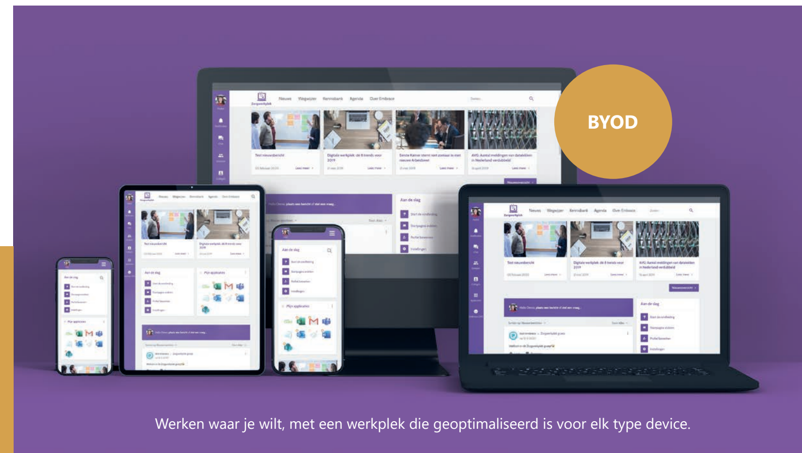
Werken waar je wilt, met een werkplek die geoptimaliseerd is voor elk type device.

eCumulus laat u zien hoe het anders kan. Het is ons antwoord op uw vraag naar meer flexibiliteit, mobiliteit en productiviteit tegen lagere kosten. eCumulus is de meest complete werkplek oplossing, inclusief geïntegreerde applicaties, hosting, beheer, beveiliging en support. Schaalbaar, applicatie-onafhankelijk en toekomstvast.